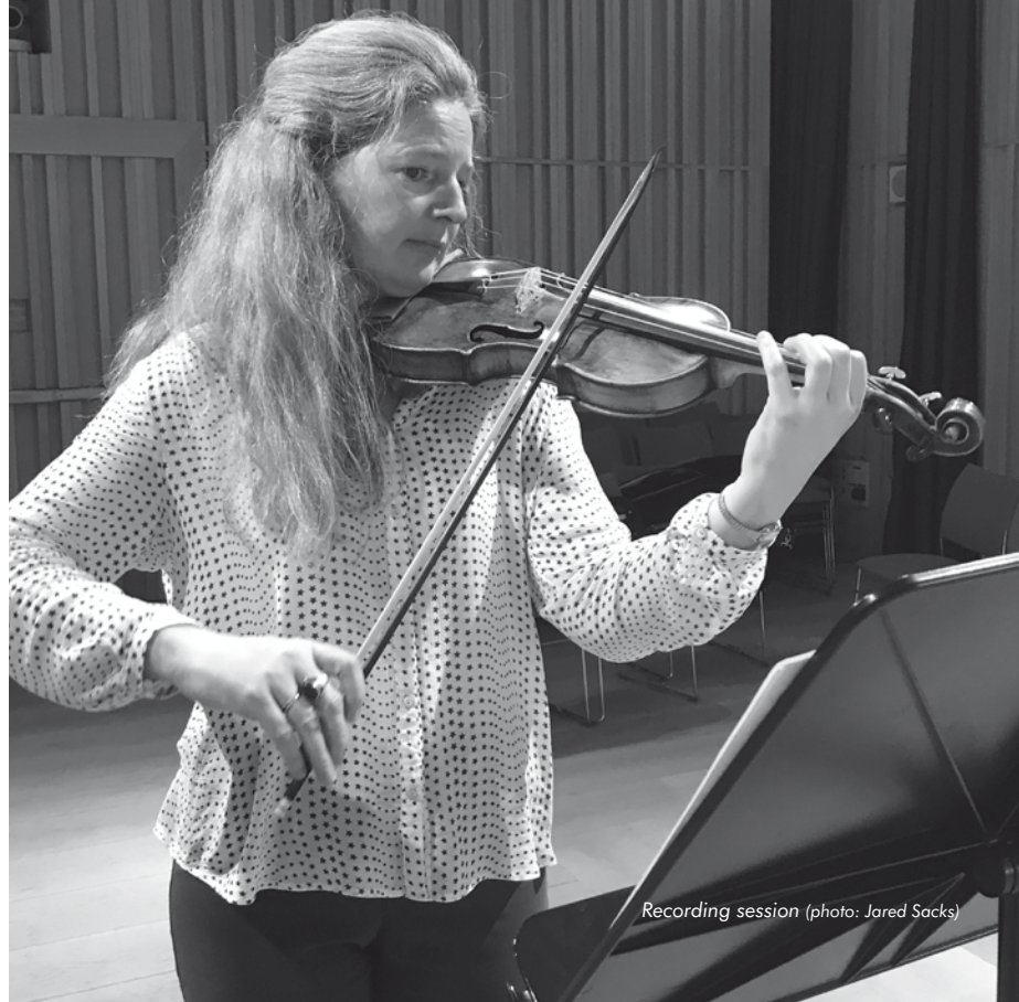
Recording session

Die Suite als instrumentale Form entstand aus einer Abfolge verschiedener Tänze; diese