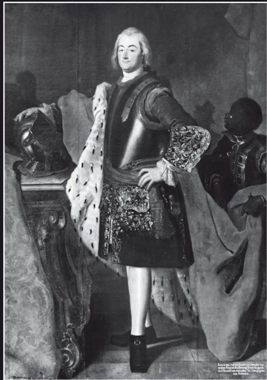
Leopold von Anhalt-Köthen

instrumentale profane. Ses six Concertos brandebourgeois figurent parmi les œuvres créées à cette époque, au même titre que son premier livre du Clavier bien tempéré et ses quatre premières Suites françaises.