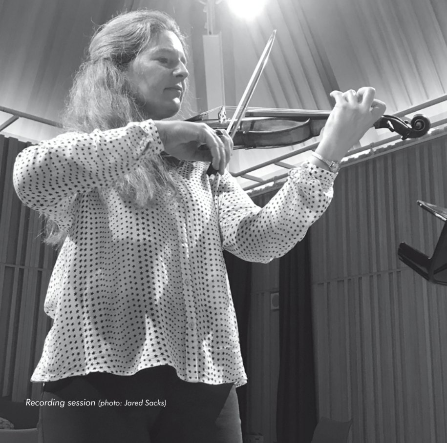
Recording session